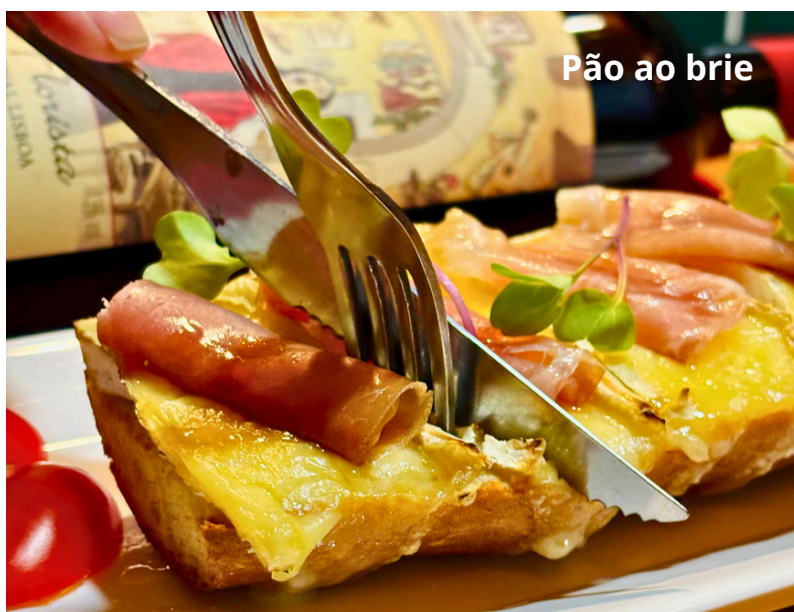
Pão ao brie