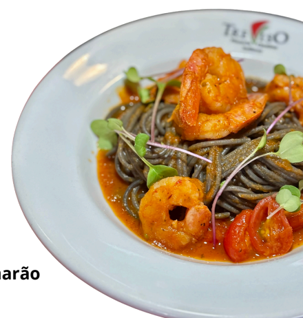
Espaguete negro com camarão

Talharim de espinafre com delicioso molho de queijo e finalizado com nozes