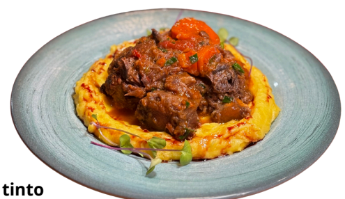
Rabada ao vinho tinto com purê de mandioquinha