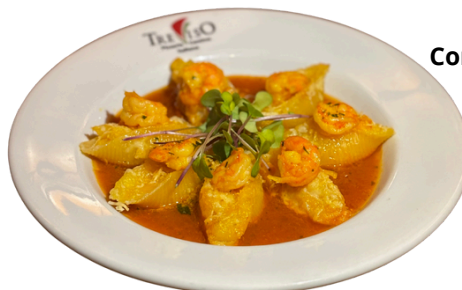
Conchiglione de camarão

R$58,70 Arroz arbóreo, redução de balsâmico, parmesão, presunto parma crocante