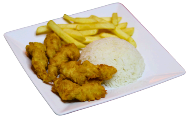
Frango à milanesa

Isca de frango à milanesa, acompanhado de arroz branco e batata frita.